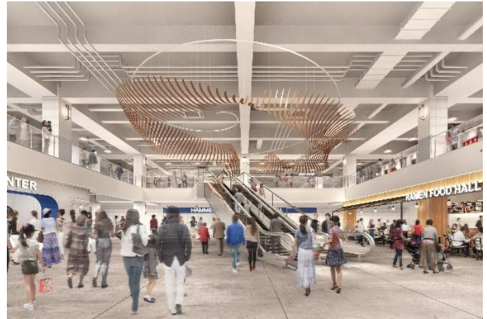
▲商業1階イメージ(吹き抜け部分)

1階と2階をつなぐダイナミックな吹き抜け空間には海をテーマにしたアートオブジェを設置。より海での楽しさや賑わいを演出しています。